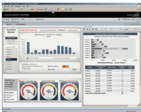
1. ábra: SAP® BusinessObjects™ Dashboard Builder keret a riportok és dashboardok számára

Az SAP® BusinessObjects™ Dashboard Builder szoftver olyan intuitív keretet biztosít, amelyben több dashboard és riport is bemutatható. A szoftver a legfontosabb üzleti intelligencia tartalmi típusok konszolidálására vonatkozó felület nélkül is képes arra, hogy a felhasználók számára biztosítsa a szükséges betekintést a szervezet egészébe a megalapozott döntések meghozatala érdekében.